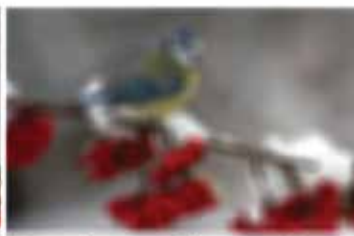
Kataraktos paveiktas regėjimas

Sergant katarakta tampa sudėtinga atlikti įprastinius kasdienesius darbus, užsiimti mėgstama veikla (skaitymu, mezgimu, rankdarbiais, maisto gaminiu). Kai lęšiuko skaidrumas ima trukdyti įprastinei veiklai reikėtų ilgai nedelsiant pasikonsultuoti su gydytoju.