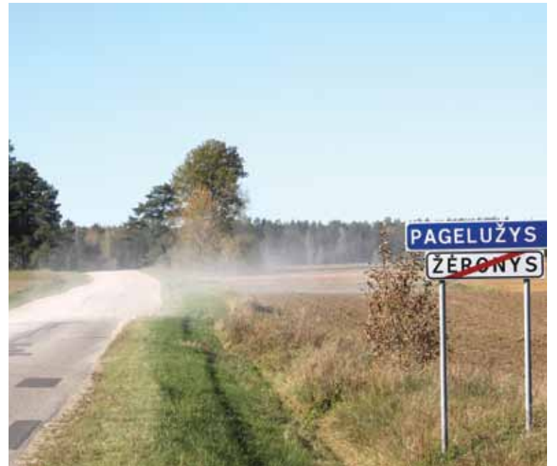
Dulkėtas kelias į Tiltus

3. Trakų rajono savivaldybė, gavusi 2017 m. spalio 12 d. Tiltų gyventojų prašymą dėl kelio ruožo Žeronys–Tiltai išasfaltavimo, 2017 m. lapkričio 22 d. parengė Trakų rajono savivaldybės tarybos sprendimo projektą „Dėl Trakų rajono savivaldybės 2017 m. birželio 1 d. sprendimo Nr. S1-130 „Dėl Trakų rajono 2017–2020 m. valstybinės reikšmės kelių asfaltuotųjų ruožų tarp skirtingų kelio dangų prioritetinės eilės patvirtinimo“ pakeitimo“. Šio sprendimo projekto aiškinamajame rašte nurodė, kad <...>...atsižvelgiant į Tiltų kaimo, Rūdiškių seniūnijos, gyventojų prašymą įrengti asfaltbetonio dangą