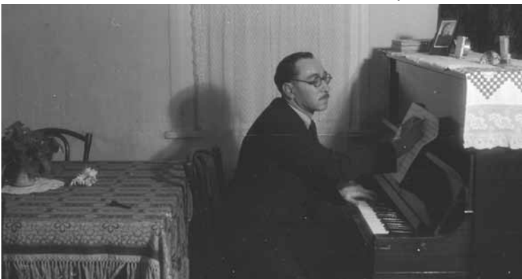
Kompozitorius Michailas Tinfovičius