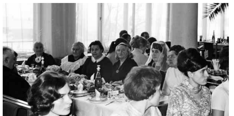
Moterų vakaronė restorane „Galvė“, 1971 m.