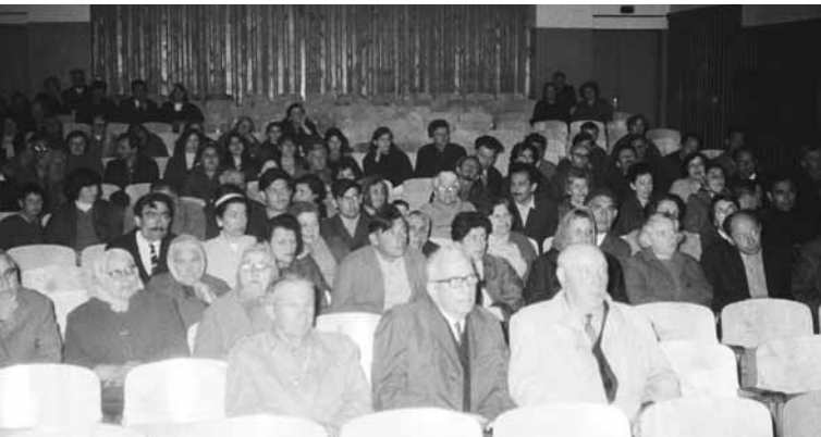
Kraštotyros susirinkimas 1969 m. gegužės 18 d.